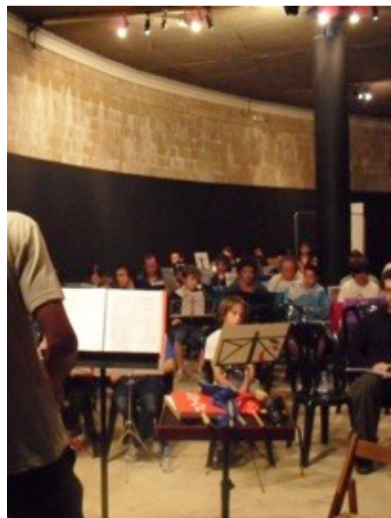
Detall de l'assaig fet a la sala medieval de sota la plaça Sant Joan