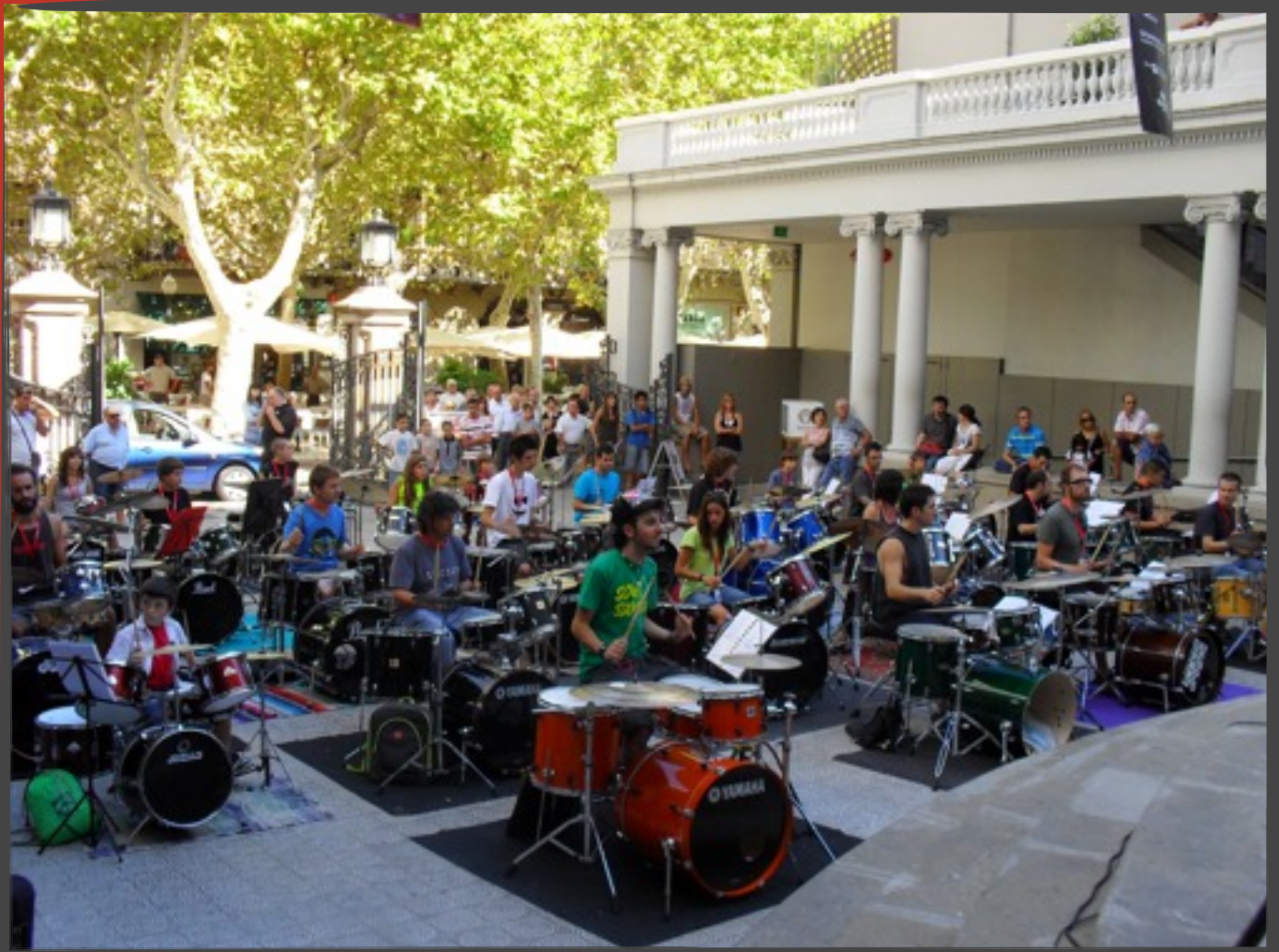
Moment de l'assaig. Molts vianants no se'l van voler perdre.