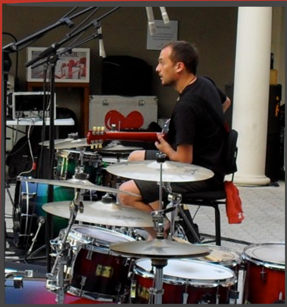
El guitarrista de "Gossos" fent les poves de so prèvies al concert.