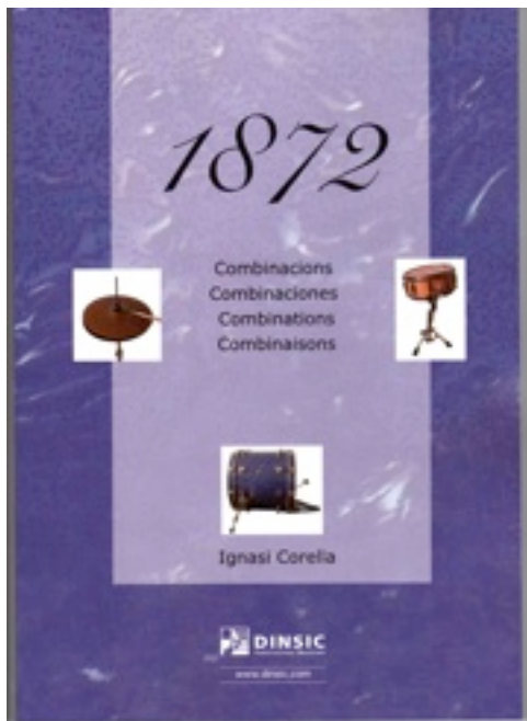
Portada del llibre